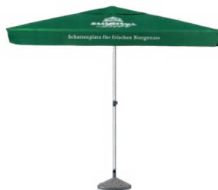
ZB Sonnenschirm 2 x 2 m Seperat erhältlich: Schutzhülle Art.Nr. 14221 Bestonsockel: Art.Nr. 14222