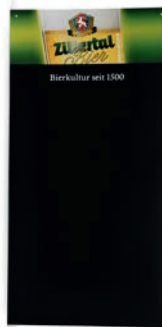
Schreibtafel H: 100 cm | B: 50 cm Art.Nr. 14181