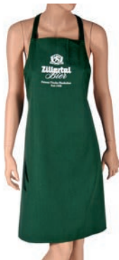
Latzschürze L: 97 cm | B: 69 cm Art.Nr. 13018