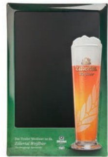
Weißbier Blechkreidetafel H: 60 cm | B: 45 cm Art.Nr. 13504