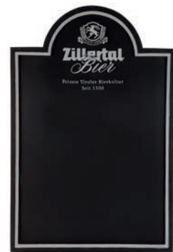
Schreibtafel rustikal H: 74,80 cm | B: 49,3 cm Art.Nr. 14182