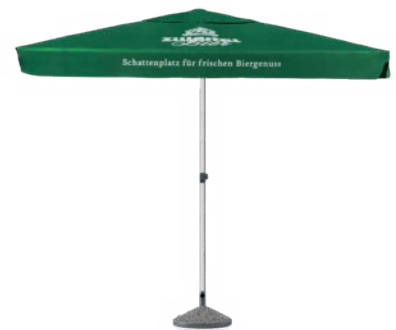
ZB Sonnenschirm 3,5 x 3,5 m Seperat erhältlich: Schutzhülle: Art. Nr. 14211 Betonsockel: Art. Nr. 14212 Plattenständer: Art. Nr. 14213 Bodenhülse: Art. Nr. 14214 Schirmständer (Feste): Art. Nr. 19022