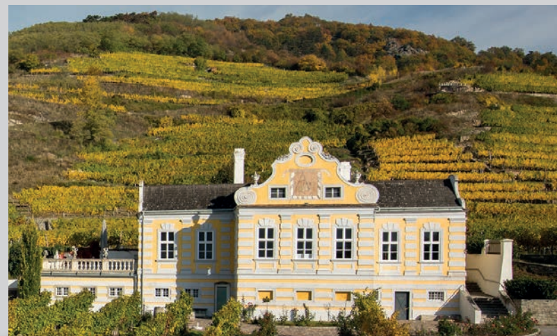
Das barocke Kellerschlüssel der Domäne Wachau in Dürnstein