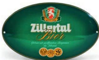
ZB Emailschild Oval H: 25 cm | B: 40 cm Art.Nr. 14186