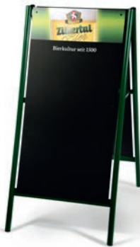
A-Ständer H: 120 cm | B: 56 cm | T: 70 cm Art.Nr. 14180